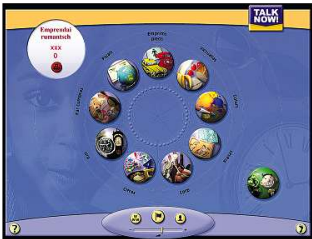
Nov unitads tematicas per tgi che vul trenar sias enconuschientschas da rumantsch.

Talk Now! Rumantsch: Il program sin CD-Rom sa drizza ad uffants ed a principiants da tut las vegliadetgnas e porscha gieus linguistics interactivs che gidan ad emprendre novs plets cun sustegn da fotografias. A maun da gieus divertents pon ins controllar l'agen level linguistic. Cun collecziunar puncts pon ins obtegnair in diplom da bronz, argent u aur. Tgi che