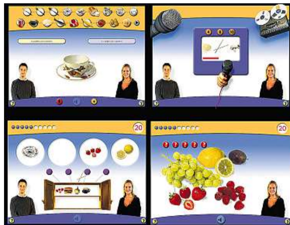
In'unitad – quatter pussibilitads d'exercitar ils plets dal champ tematic «victualias»: exercizis da plets, exercizis da discurre, gieu simpel, gieu complex.

vul, po registrar l'atgna vusch e controllar la pronunzia. Plinavant pon ins telechargiar la datoteca audio sin l'iPod u sin il player MP3 per exercitar cur ch'ins vul.