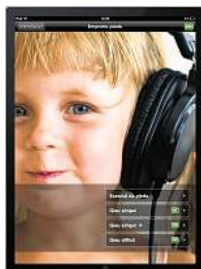
En in vestgi pli modern sa preschentan ils programs da telechargiar e quels per l'iPad e l'iPhone.