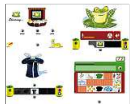
Per lavurar cun il «Vocabulary Builder» na ston ins betg anc savair leger. El è adattà per uffants a partir da 4 onns.